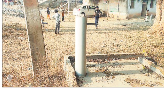
शो पीस बना नल कनेक्शन।